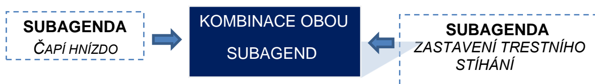
Schéma 2 Analyzovaná agenda a její součásti

Jako relevantní příspěvek byla kódována čtená zpráva, rozhovor, komentář tematizující danou agendu (jednu zde tří subagend). V případě rozhovoru jsme dále rozlišovali tzv. konverzační sekvenci , tedy tu část rozhovoru (moderátorovu otázku, repliku), která artikulovala téma zastavení trestního stíhání (dále jen ZTS) a kauzu Čapí hnízdo (dále jen ČH) nebo jejich kombinaci (dále jen ZTS+ČH).