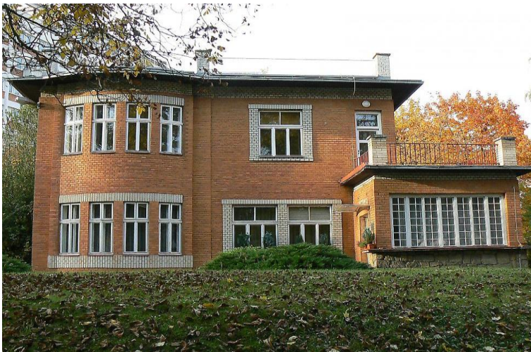
Vila J. A. Bati – sídlo ČRo Zlín