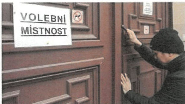
prezidentské volby 2023