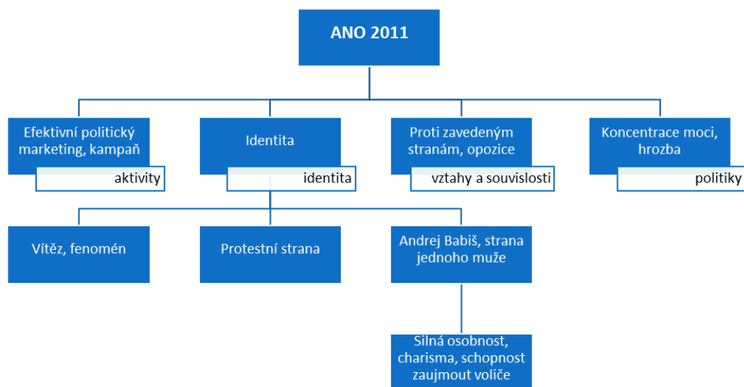
Obrázek č. 1: Diskurzivní schéma – ANO 2011

ČSSD je pak v komunikační strategii prezentována především skrz oblast identity, konkrétně identity poražené strany v sestupné trajektorii, strany, která je tradiční, etablovaná, ale působící poněkud strnule, bez energie, bez nových tváří a silného, charismatického lídra, který by dokázal jednoduše oslovit voliče. Na základě voleb je pak v oblasti souvislostí rozehrávána především oblast vztahů uvnitř strany samotné a přítomnost odpůrců Bohuslava Sobotky, kteří patrně po očekávaném neúspěchu v letošních sněmovních volbách budou usilovat o nahrazení Bohuslava Sobotky v čele strany. V dané optice je pak zvýznamňováno vítězství ČSSD v Jihočeském kraji (jakožto protiklad celkového neúspěchu strany ve volbách), které z hejtmana Zimoly činí možného budoucího kandidáta na předsednický post.